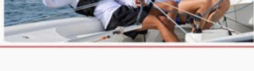
نشرة شمول البريدية للمربع الرابع ٢٠٢٤