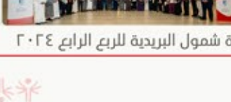
نشرة شمول البريدية للمربع الرابع ٢٠٢٤

أفاق واعدة واستراتيجيات مبتكرة ضمن اجتماع العمل لقادة برامج الأولمبياد الخاص لمنطقة الشرق الأوسط وشمال أفريقيا بحضور من الأولمبياد الخاص السعودي لتعزيز الجهود المشتركة.