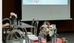
نشرة شمول البريدية للمربع الرابع ٢٠٢٤