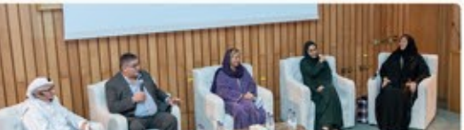
نشرة شمول البريدية للمربع الرابع ٢٠٢٤