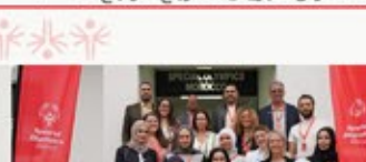
نشرة شمول البريدية للمربع الرابع ٢٠٢٤

يواصل الأولمبياد الخاص السعودي جهوده في زيادة الوعي وتقديم الدعم المعنوي للعبين وعائلاتهم وذلك من خلال إقامة مجموعة من ورش العمل بعنوان "الإعداد النفسي للاعبي الأولمبياد الخاص" و "مقدمة تعريفية عن الأولمبياد الخاص" و "ملتقى الأهالي"