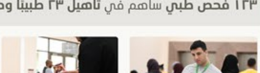
نشرة شمول البريدية للمربع الرابع ٢٠٢٤