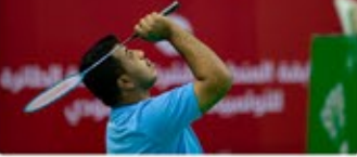
نشرة شمول البريدية للمربع الرابع ٢٠٢٤

اختتم الأولمبياد الخاص السعودي عام ٢٠٢٤ بمسابقة الريشة الطائرة للأولمبياد الخاص السعودي في مدينة الاحساء. بمشاركة أربعة أندية بالتعاون مع الاتحاد السعودي للريشة الطائرة.