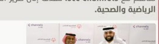
نشرة شمول البريدية للمربع الرابع ٢٠٢٤