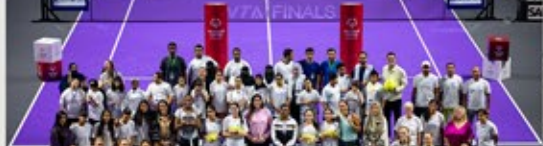
نشرة شمول البريدية للمربع الرابع ٢٠٢٤

بالتعاون مع الاتحاد السعودي للتنس شارك لاعبو الأولمبياد الخاص السعودي في مراسم قرعة بطولة رابطة اللاعبين المحترفات للتنس (WTA) صاحبها دخولهم مع اللاعبات المحترفات والمشاركة في أجواء رياضية مليئة بالترفيه والمتعة.