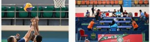
نشرة شمول البريدية للمربع الرابع ٢٠٢٤