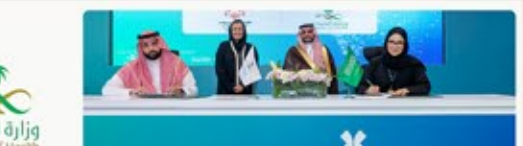
نشرة شمول البريدية للمربع الرابع ٢٠٢٤