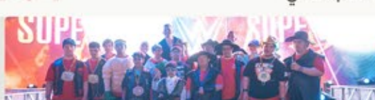
نشرة شمول البريدية للمربع الرابع ٢٠٢٤

أبطال الأولمبياد الخاص السعودي يلتقون بنجوم WWE بأجواء من المرح والحماس وذلك بالتعاون مع الهيئة العامة للترفيه